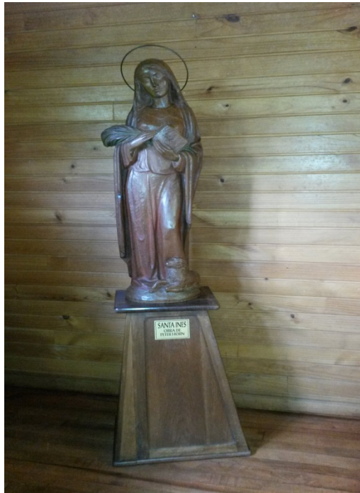
IMAGEN DE SANTA INES TEMPLO PARROQUIAL